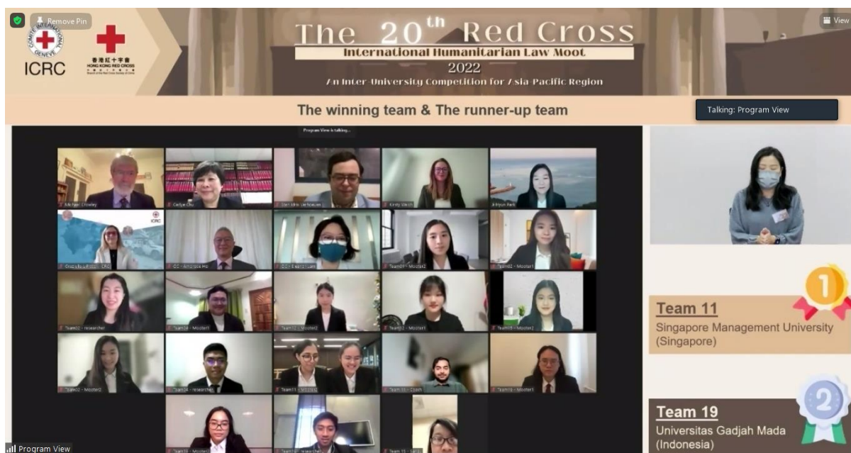
【圖一】決賽與頒獎典禮更於網上同步直播，紅十字國際委員會、香港紅十字會、以及世界各地的評審和參加者一同參與，打破了地域和時區的限制，通過比賽向世界宣揚國際人道法的重要性。