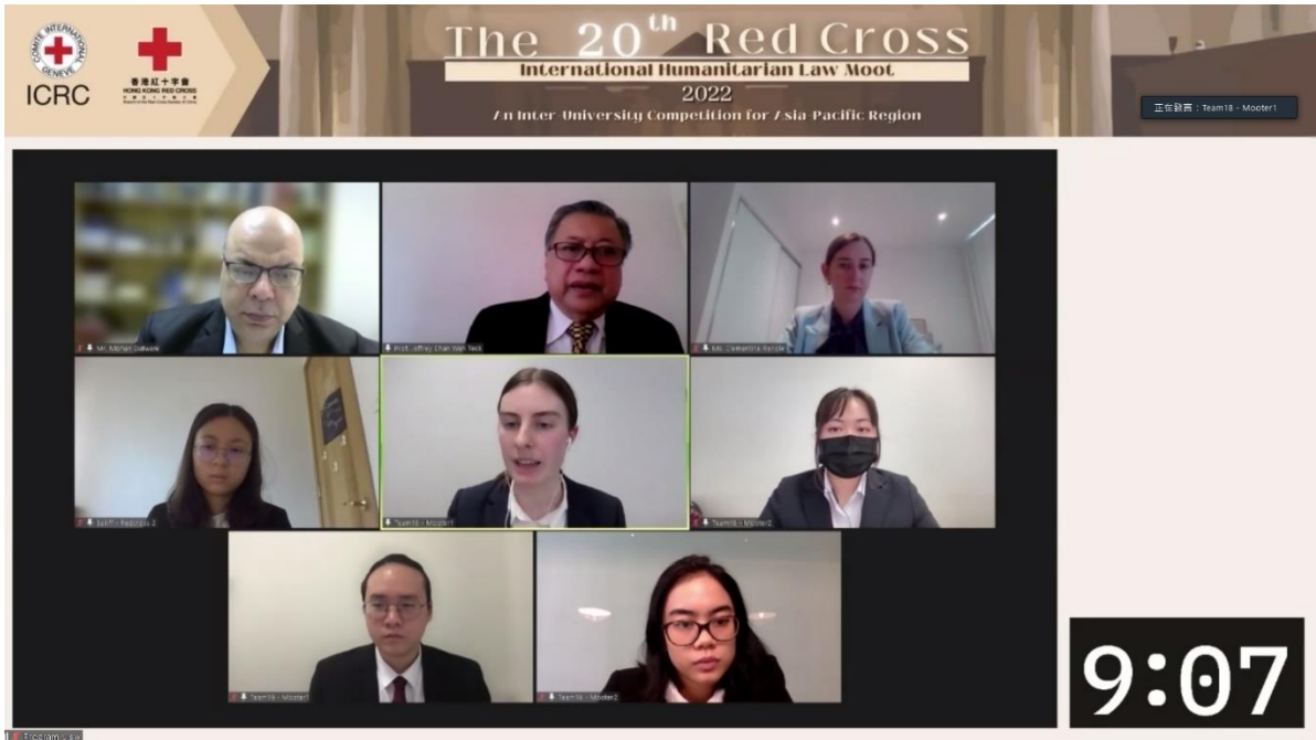
【圖三】線上模擬法庭比賽戰況緊湊，控辯雙方在模擬訴訟中均據理力爭。