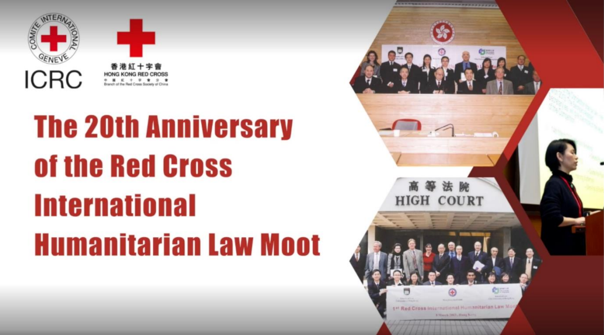
【圖四】本屆比賽為第 20 屆舉辦亞太區紅十字國際人道法模擬法庭比賽，特播放紀念影片慶祝二十週年。