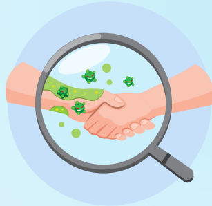
ਚਿਕਨਪੋਕਸ ਜਾਂ ਹਰਪੀਜ਼ ਜ਼ੋਸਟਰ ਨਾਲ ਸਿੱਧੇ ਜਾਂ ਅਸਿੱਧੇ ਤੌਰ 'ਤੇ ਸੰਪਰਕ